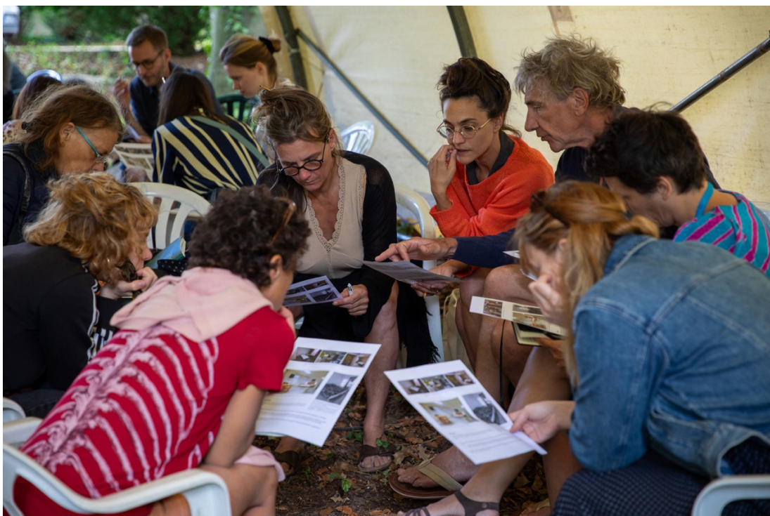
Un atelier. (2023)