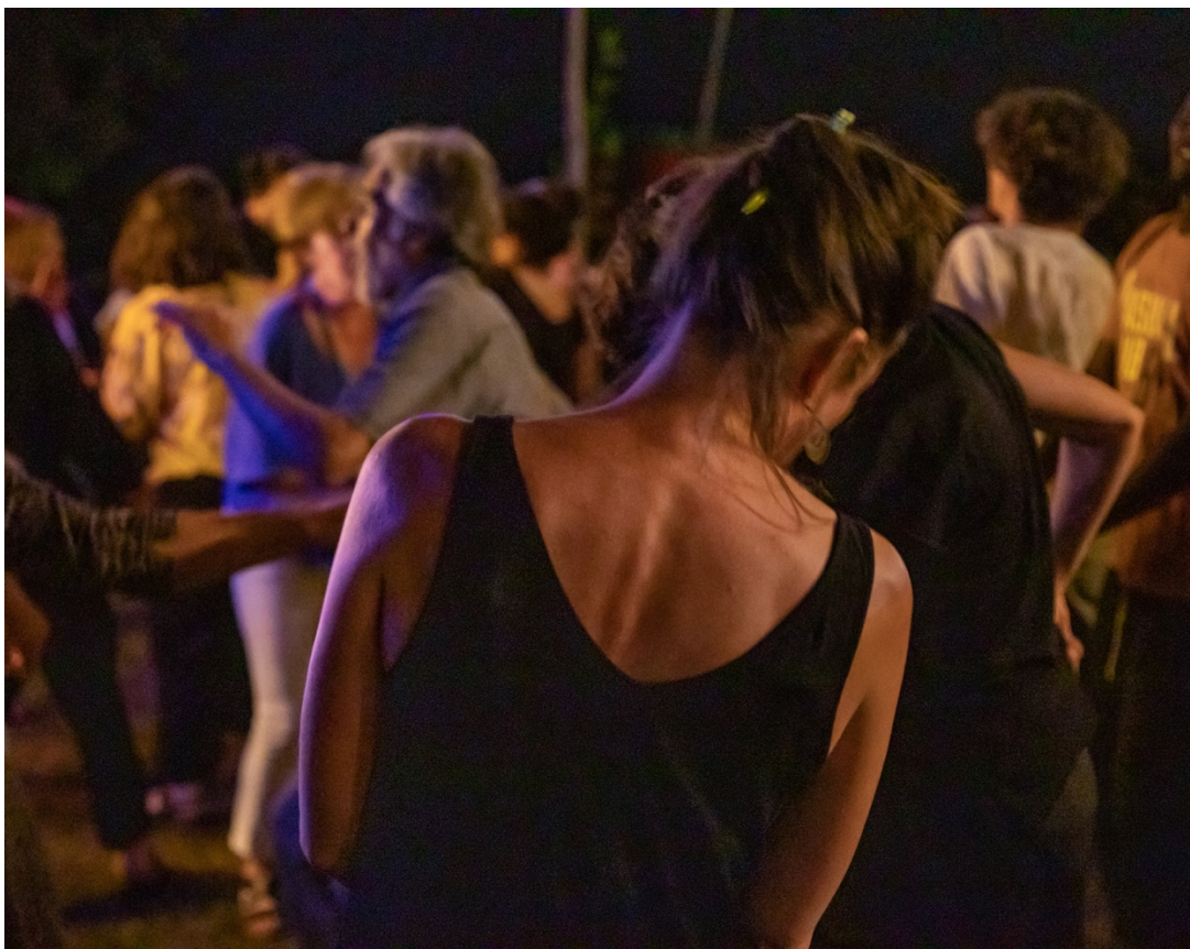
La Cantina. Photo Béatrix Von Conta (2023)

Concertina, Association loi 1901 25 rue Justin Jouve 26220 Dieulefit Siret 894 660 943 00016