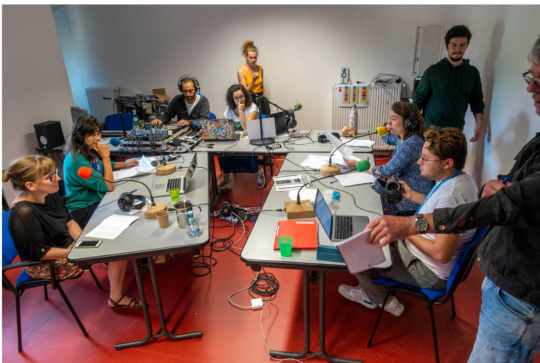
Radio Ici L'Ombre.

Concertina, Association loi 1901 25 rue Justin Jouve 26220 Dieulefit Siret 894 660 943 00016